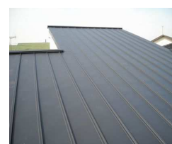
屋根:ガルバリウム鋼板